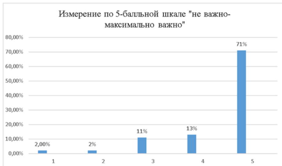
Рис 1. Распределение ответов респондентов на вопрос: «Насколько важна для Вас семья?» (в % числу ответивших).

На графике важности семьи можно увидеть, что большинство респондентов, а именно 71%, отметили важность семьи на уровне 5, что означает, что для них семья максимально важна. Это свидетельствует о том, что для большинства людей опрошенной выборки семейные отношения играют значительную роль в их жизни.