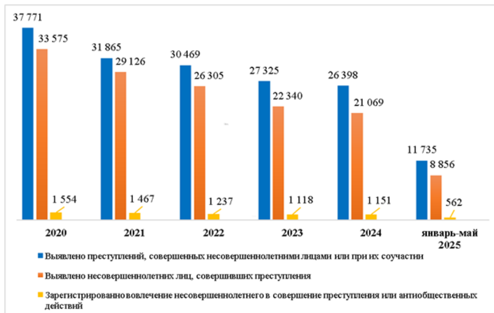
Рисунок 1. Статистические данные о преступности несовершеннолетних

Обратимся к статистике предварительно расследованных преступлений, совершенных несовершеннолетними (Рисунок 2) (См.: Портал правовой статистики Генеральной Прокуратуры Российской Федерации. [Электронный ресурс] – URL: http://crimestat.ru/ ). Анализируя, мы видим, что большую часть составляют преступления небольшой и средней тяжести. Наблюдается рост тяжких преступлений среди несовершеннолетних. Однако данные Генеральной Прокуратуры представлены до 2022 г. Но другие источники свидетельствуют о том, что в настоящее время данная тенденция сохраняется, хоть и не отражена в официальных открытых статистических данных. По итогам оперативного совещания, председатель Следственного комитета Российской Федерации А.И. Бастрыкин сообщил, что с января по апрель 2025 года число тяжких и особо тяжких преступлений, совершенных несовершеннолетними, увеличилось в полтора раза (См.: СКР: подростки стали чаще совершать преступления. Коммерсантъ. [Электронный ресурс] – URL: https://www.kommersant.ru/doc/7775811?ysclid=mdvea13rep621661649 (дата обращения: 17.07.2025)).