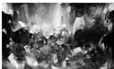
Чжу Дэцзюнь «Ритм возрождения» (рис.1)

Произведения Чжу Дэцзюня в зрелом возрасте отличаются как от традиционной китайской живописи, так и от западной абстрактной живописи. В этих работах сочетаются спонтанность традиционной китайской литературной живописи и музыкальные мотивы, характерные для творчества Кандинского [11, с.23] .