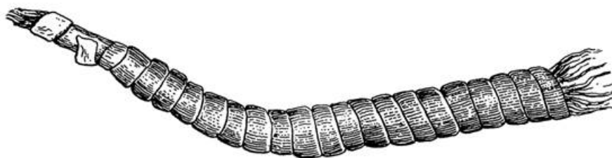
Фото 5. Накосник пулокерь (из книги Р.Ф. Ворониной «Лядинские древности...»).

По мнению А.Я. Флиера, «культура – это всегда повторение каких-то действий, причем более или менее стандартизированное в технологическом смысле» [17, с. 24]. Анализ археологических материалов (Крюково-Кужновский и Елизавет-Михайловский могильники VIII–XI вв. н.э.) показывает, что форма накосника создавалась деятельностью женщины, которая окручивала косу кожаным ремнем, предварительно обвитым проволокой. В результате органично возникала асимметричная форма, повторявшая собой заплетенную косу. Каждое регулярно повторявшееся, индивидуально совершаемое женщиной заплетение косы могло отличаться от предыдущего или включать в себя незначительные изменения. Однако данный спиралевидный способ формообразования создал новый элемент женского головного убора, характеризующийся декоративным аскетизмом, лаконичностью выразительных средств, жесткостью и четкостью линий (см. Фото 5).