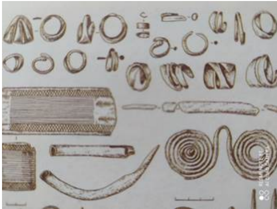
Фото 1. Фатьяновские украшения (из книги В.А. Юрченкова «Занимательная археология»).

Примокшанская археологическая культура («рубеж III – II тыс. до н.э.» до XVII в. до н.э.), охватывавшая «кроме бассейна Мокши территорию Среднего Поочья» на Паевском городище сохранила образец спиралевидного украшения: у одной (из двух) бронзовой булавки «...верхний конец расплюсчен и преобразован в спиральные завитки» [2, с. 161, 153, 157]. Исследователи называют в качестве технологии создания металлических украшений абашевской культуры «сворачивание спирали из проволоки». Получаемыми спиральными пронизками женщины расшивали свою одежду [9, с. 62]. Абашевские и срубные археологические памятники сохранили бытование украшений, выполненных в своеобразной форме, которую сегодня принято называть спиралевидной: височные кольца в 1,5–2 оборота, трубочки-пронизки, очко-видные подвески, а также спиралевидная заколка и гривна Сабанчеевского клада, концы которой «закручены в виде пятивитковых спиральных дисков» (см.: [11, с. 155]), (см. Фото 2).