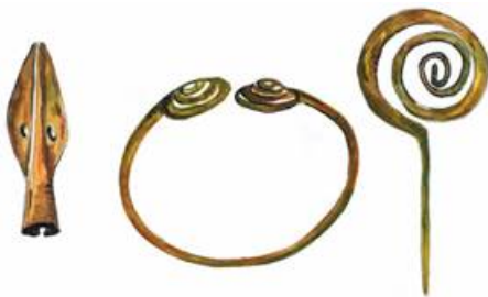
Фото 2: Копье, бронзовая булавка и гривна из Сабанчеевского клада эпохи бронзы.

Примокшанская археологическая культура («рубеж III – II тыс. до н.э.» до XVII в. до н.э.), охватывавшая «кроме бассейна Мокши территорию Среднего Поочья» на Паевском городище сохранила образец спиралевидного украшения: у одной (из двух) бронзовой булавки «...верхний конец расплюсчен и преобразован в спиральные завитки» [2, с. 161, 153, 157]. Исследователи называют в качестве технологии создания металлических украшений абашевской культуры «сворачивание спирали из проволоки». Получаемыми спиральными пронизками женщины расшивали свою одежду [9, с. 62]. Абашевские и срубные археологические памятники сохранили бытование украшений, выполненных в своеобразной форме, которую сегодня принято называть спиралевидной: височные кольца в 1,5–2 оборота, трубочки-пронизки, очко-видные подвески, а также спиралевидная заколка и гривна Сабанчеевского клада, концы которой «закручены в виде пятивитковых спиральных дисков» (см.: [11, с. 155]), (см. Фото 2).