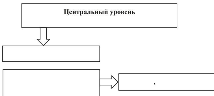
Рис. 3. Система управления архивным делом с уровнем управления Б

Такая система действует в Республике Казахстан. На региональном уровне органам государственной власти (акиматам) областей, городов республиканского значения и столицы непосредственно подчинены