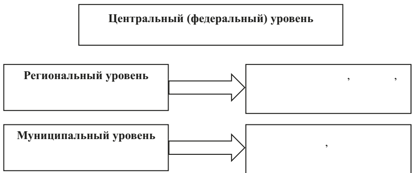
Рис. 4. Децентрализованная система с тремя не соподчиненными уровнями управления

В связи с образованием в составе Российской Федерации новых субъектов – Донецкой Народной Республики, Луганской Народной Республики, Запорожской области и Херсонской области – Архивный фонд Российской Федерации включил документы государственных архивов Донецкой и Луганской народных республик, а также эвакуированной части Государственного архива Херсонской области. Соответственно, действующая сеть архивных учреждений Российской Федерации приросла архивными учреждениями четырех названных регионов.