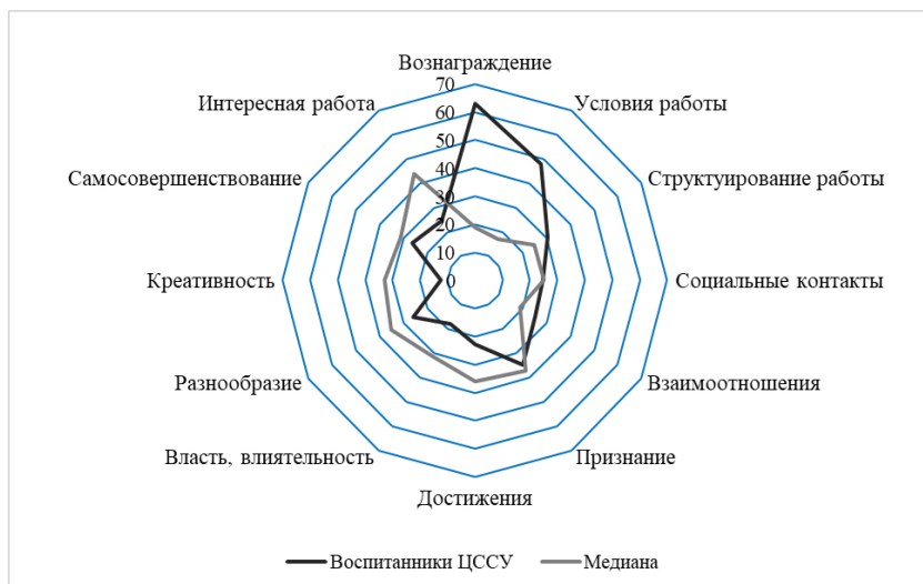
Рис. 1. Средние значения показателей мотивационных потребностей воспитанников ЦССУ

На рисунке 1 показаны средние значения показателей мотивационных потребностей воспитанников ЦССУ по каждому из 12 критериев.