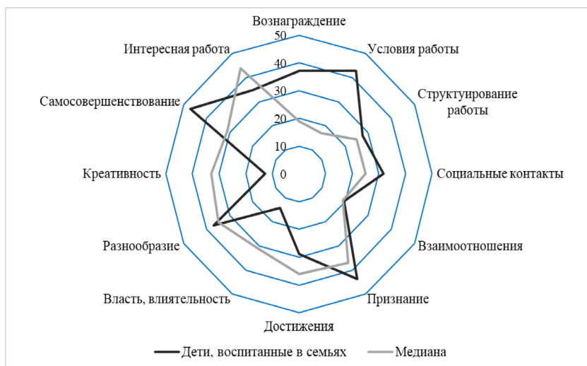
Рис. 2. Средние значения показателей мотивационных потребностей детей, воспитанных в семьях

При этом такие параметры, как разнообразие (35,4), структурирование работы (29,4), социальные контакты (26,7), взаимоотношения (18,5) существенно не отличаются от медианных значений и отражают вполне типичное стремление к периодической смене осуществляемых видов деятельности, выполнению своих рабочих обязанностей и внешнему контролю своей деятельности, наличию деятельности, связанной с взаимодействием с людьми и наличием возможности установления близких контактов с сослуживцами.