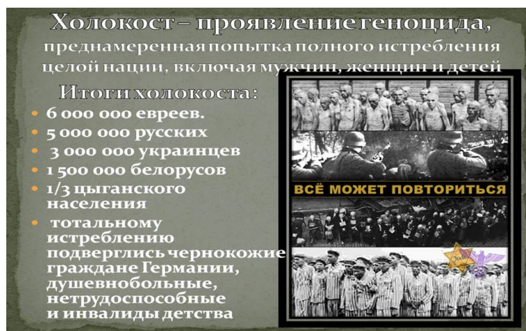
Рис. 1. Холокост.