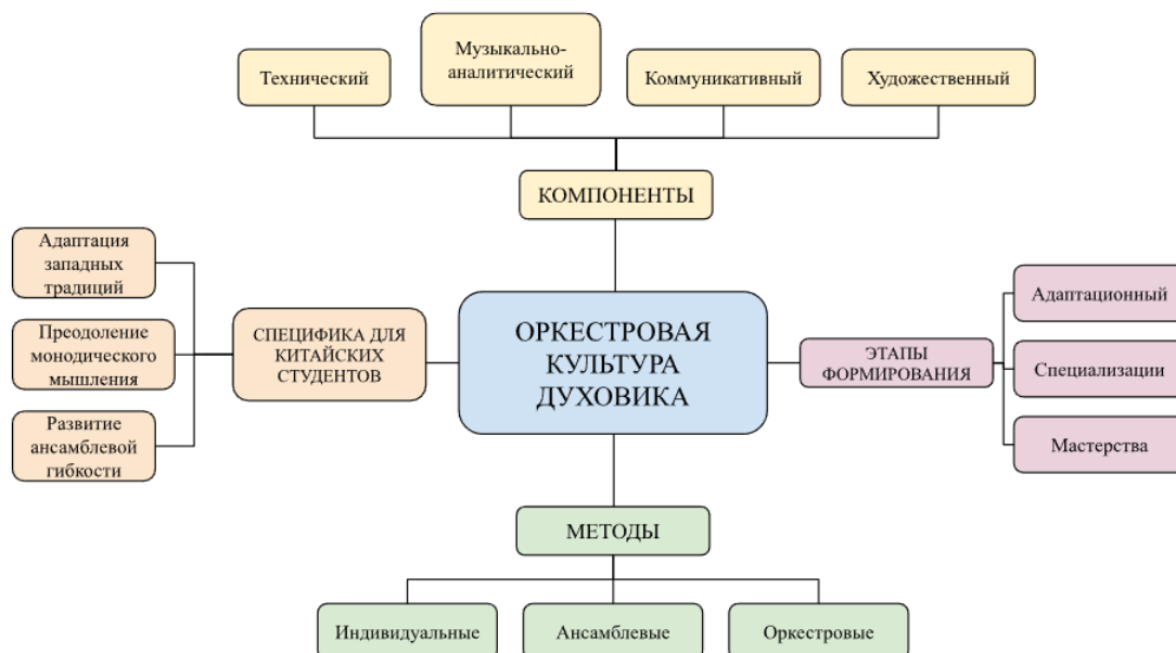
Рис. 1. Формирование оркестровой культуры у студентов-духовиков. Составлено автором. Fig. 1. Formation of orchestral culture among wind instrument students. Compiled by the author.

Формирование оркестровой культуры у студентов-духовиков представляет собой сложный многоуровневый процесс, требующий комплексного теоретического осмысления (рис. 1). В основе этого феномена лежит интегративное профессиональное качество, объединяющее несколько взаимосвязанных компонентов.